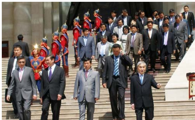
Chinggis-Khaan-Ehrung anlässlich des Staatsfeiertages 2008

Am 25. September sind beide mit sechs weiteren Mitgliedern der Bürgerbewegungspartei in die DP eingetreten.