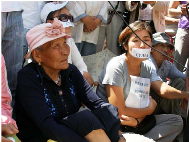
Sitzstreik auf dem Sukhbaatarplatz am 30. Juli 2008

Die abschließenden Ergebnisse aus dem Khentii-Aimag waren am 20. August der ZWK ohne Veränderungen übergeben worden.