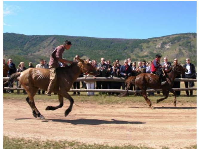
Mininaadam in Terelj anlässlich des Staatsbesuches von Bundespräsident Köhler in der Mongolei. 06.09.08

Außerdem wurde zwischen der Mongolischen Akademie der Wissenschaften, der Mongolischen Staatsuniversität (Mongol Ulsyn Ikh Surguul) und der Gerda-Henkel-Stiftung eine Vereinbarung über wissenschaftliche Zusammenarbeit bis 2010 unterzeichnet.