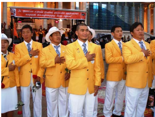
Empfang der Olympiasportler. 25.08.08

Es war das beste jemals bei Olympia erzielte Ergebnis für die Mongolei. In der Medaillenwertung belegte sie den 31. Platz unter 204 Nationen.